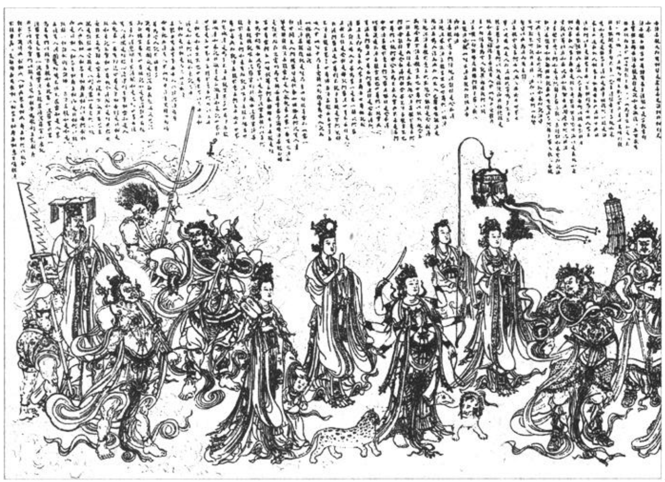
佛教流源图(白描)局部