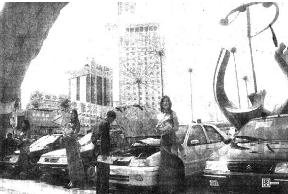
2001年春季“新世纪、新观念、新生活”汽车展示会4月21日在西城科技展览中心广场拉开帷幕。

为什么WINDOWS会出现“致命异常错误” CPU在RAM(内存)存取数据的速度远远快于RAM与硬盘交换数据的速度。